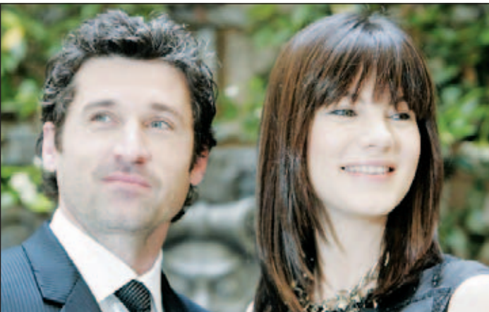
Patrick Dempsey e Michelle Monaghan, ieri a Roma per il film